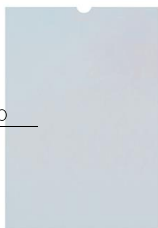
FUNDA DE PLASCTICO