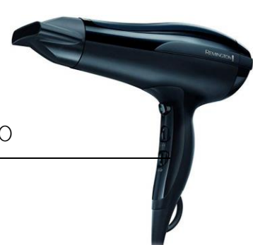
CINTA O CORDEL